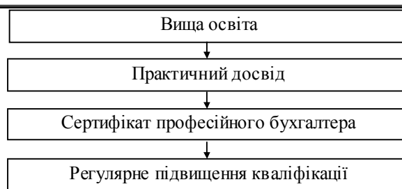
Рис. 2. Система освіти бухгалтера

Отже, суспільство від професійного бухгалтера вимагає знань, досвіду, постійного підвищення кваліфікації, а також професійної етичності. Хоча на даному етапі в Україні етичні норми до облікових працівників в письмовій формі не закріплені законодавчо, проте вони ґрунтуються на традиціях і звичаях вітчизняної практики бухгалтерського обліку. Чесність, об'єктивність та готовність займати тверду позицію є необхідними якостями професійних бухгалтерів.